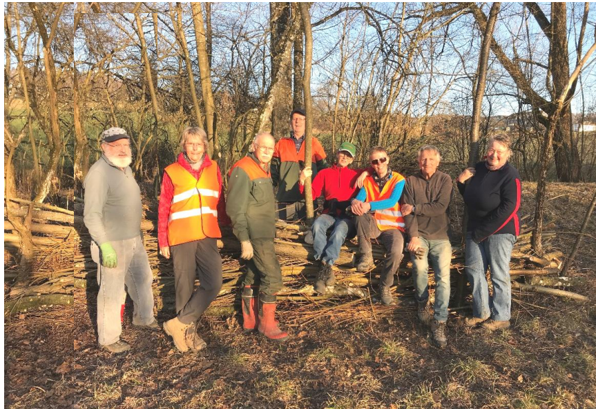
Erstellen eines Flechtzauns für Ringelnattern